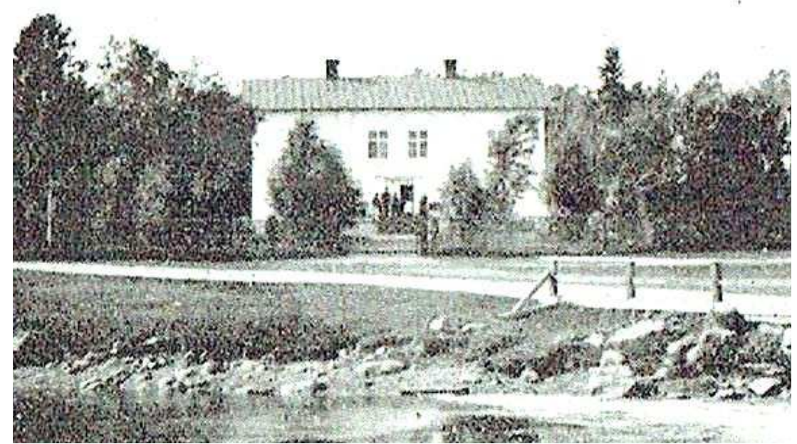
Bruksherrgården vid försäljningen 1897.