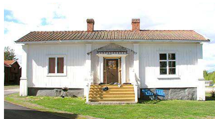
En flygelbyggnad såldes till fyrmästare Carl Fredrik Thurfjell och flyttades 1890 till norra Heden i Jävre.