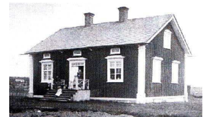
Brukskontoret innan flytten till Bruksbacken 1897.